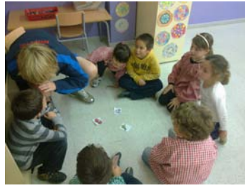
Llenguatge oral, escolta activa