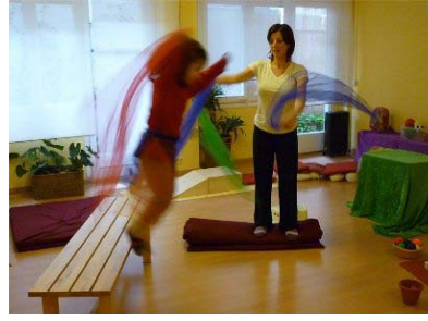
Vivència cos i espai