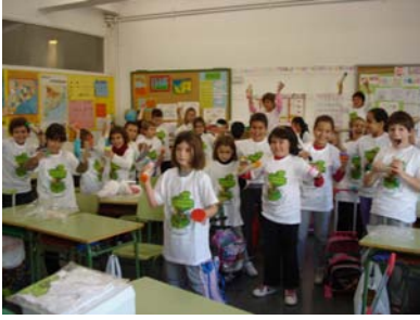
Llenguatge oral: ritme musical