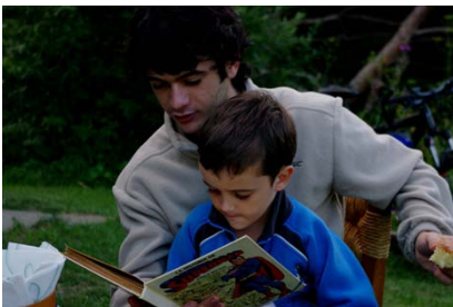
Lectura de contes, motivació